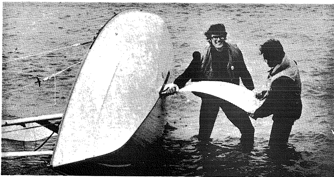
Vol trots toont speedy hier zijn buigzame staart. (sorry, zwaard).

's-middags poeierde het nog steeds Beaufort 6-8, en het geheel leek een beetje onverantwoord, maar desondanks togen wij ter start, waar wij vlak voor dat gebeuren tijdens een gijp een droge tik hoorden ergens onder uit de zwaardkast. Tja, en toen waren we een Javelin met het eerste flexibele zwaard. (is dat het geheim van de snelheid van Speedy????)