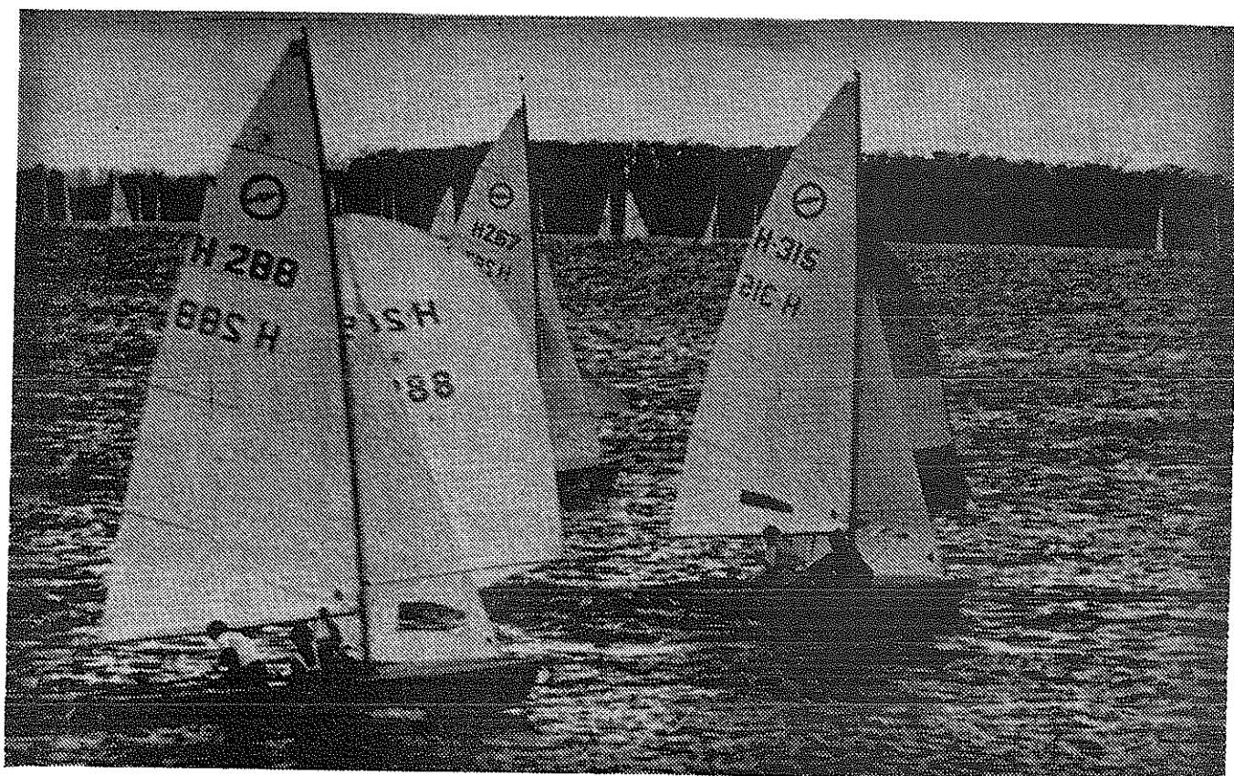
Scène uit het eerste spinnakerrak in de tweede wedstrijd.

Tegen dat de derde start moest komen werd het ijzig koud. Toen de start kwam loeide de wind door het want. Zoveel lawaai maakte dit dat niemand hoorde dat het een algehele valse start was. Ik twijfel er trouwens nog steeds aan. Maar goed, na 5 minuten werden we door een speedbootje teruggecommandeerd, waarna het startschip de uitstelwimpel hees, en de hele vloot bibberend en rillend achter moeder kloek aanvoer, opweg naar een nieuw startpunt. Hoognodig, want we konden bijna met halve wind starten. De tweede start volgde een half uur later, maar tegen die tijd waren veel zeilertjes bevangen door de kou, en er konden nog slechts weinig lachjes af.