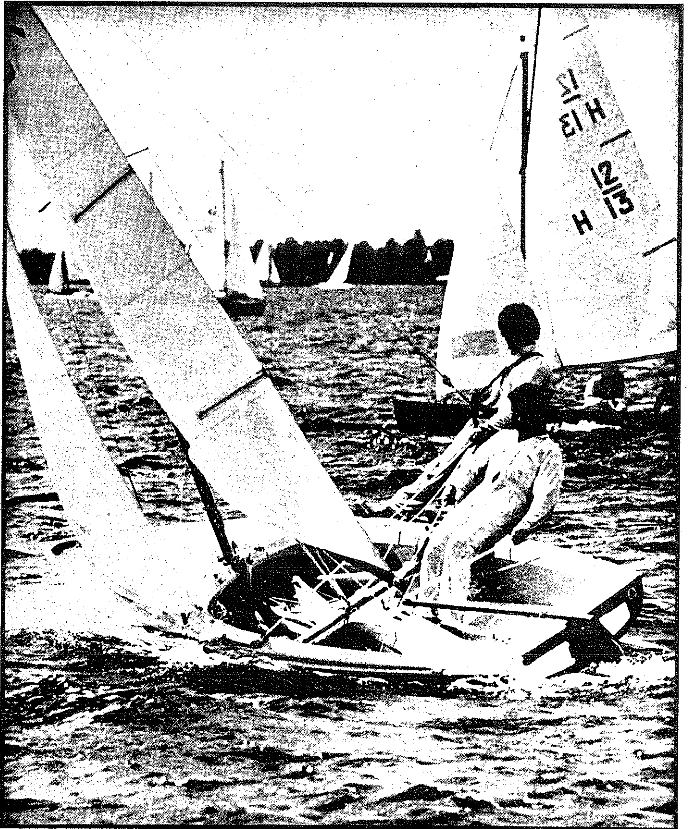
H 267 op het woelige Vinkeveen. 10 juni 1978.