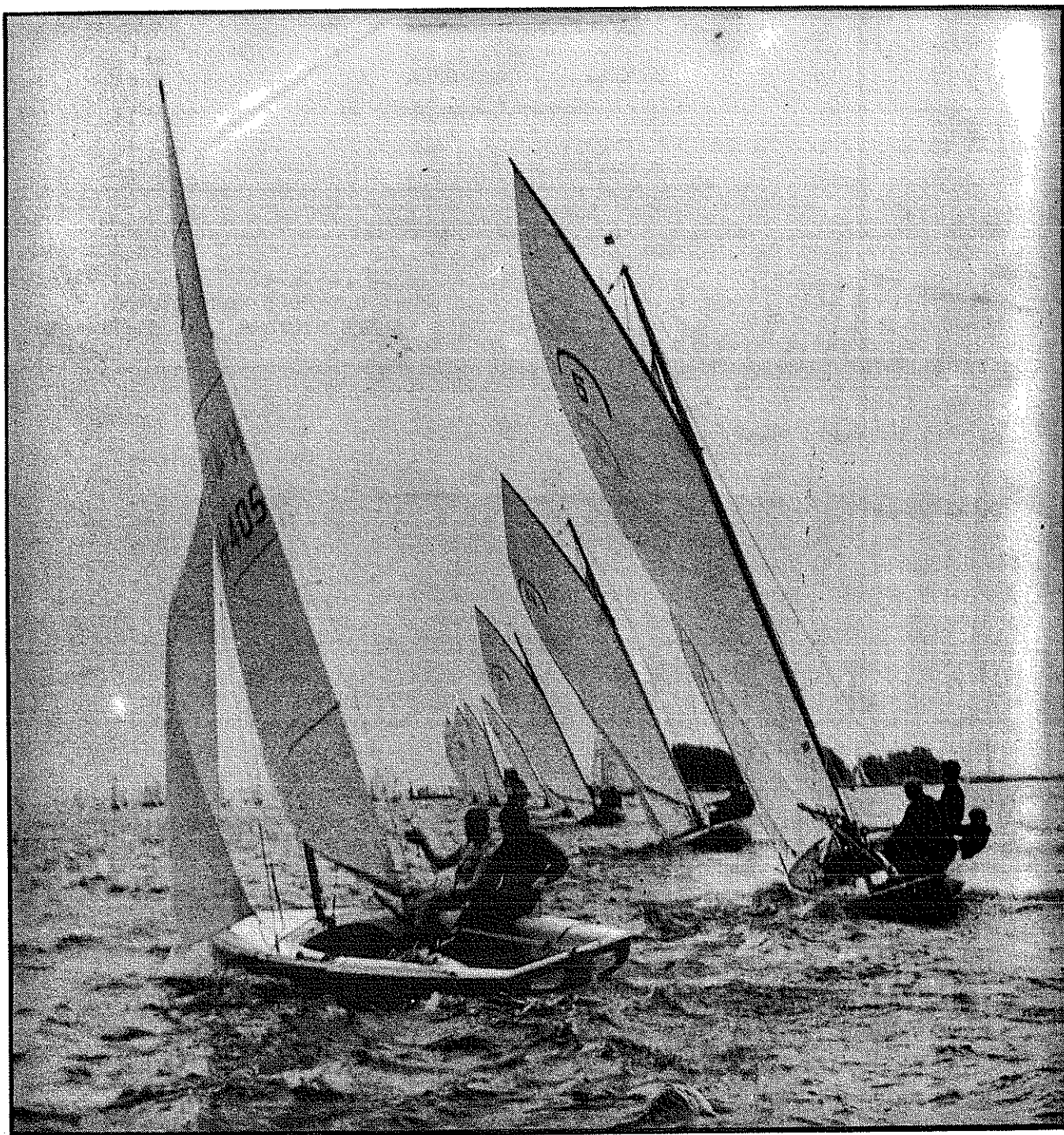
Regenbogen te Uitgeest, 1 blok vuile wind voor de JAVELIN.

officieel orgaan der NJKO. 9 e jaargang nr 3. JUNI 1980.