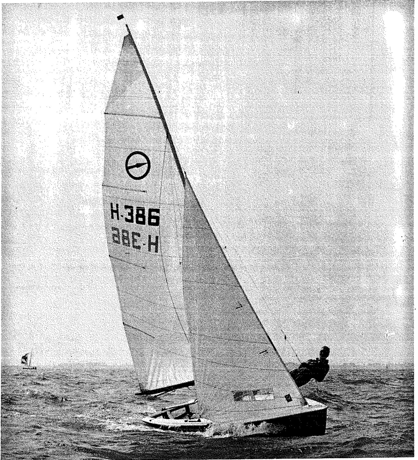
Nog een plaatje van de EK te Monnickendam.