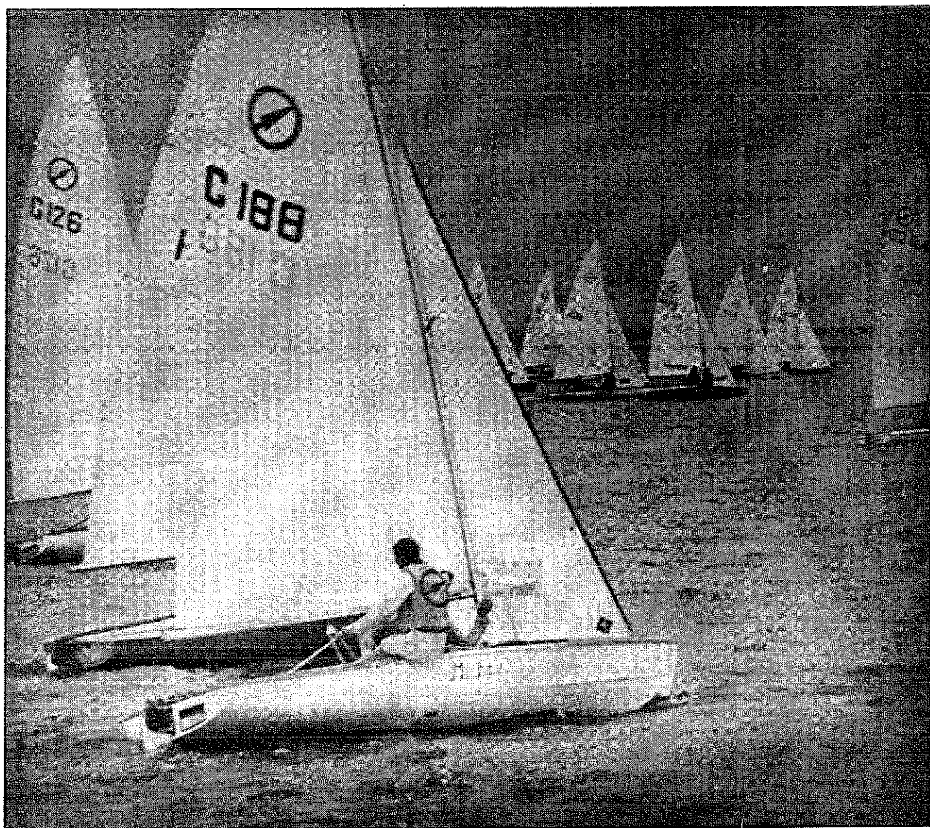
REUZE OPKOMST OP JAVELIN EK GOLD CUP in TRACEMUNDE.

OFFICIEEL ORGAAN DER NJKO. 12e JAARGANG NR 3 . AUGUSTUS 1983 .