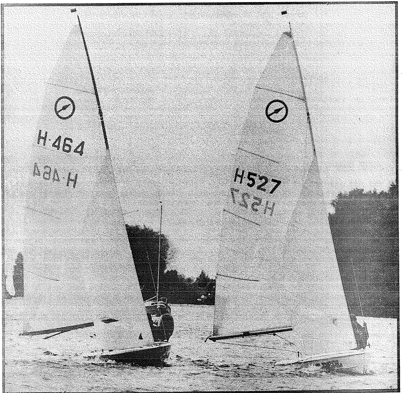
Hier de nrs. 1 en 2 van de jaarbeker 1984 broederlijk naast elkaar.

OFFICIEEL ORGAAN DER NJKO. 14e JAARGANG NR 1. FEBRUARI 19 85.