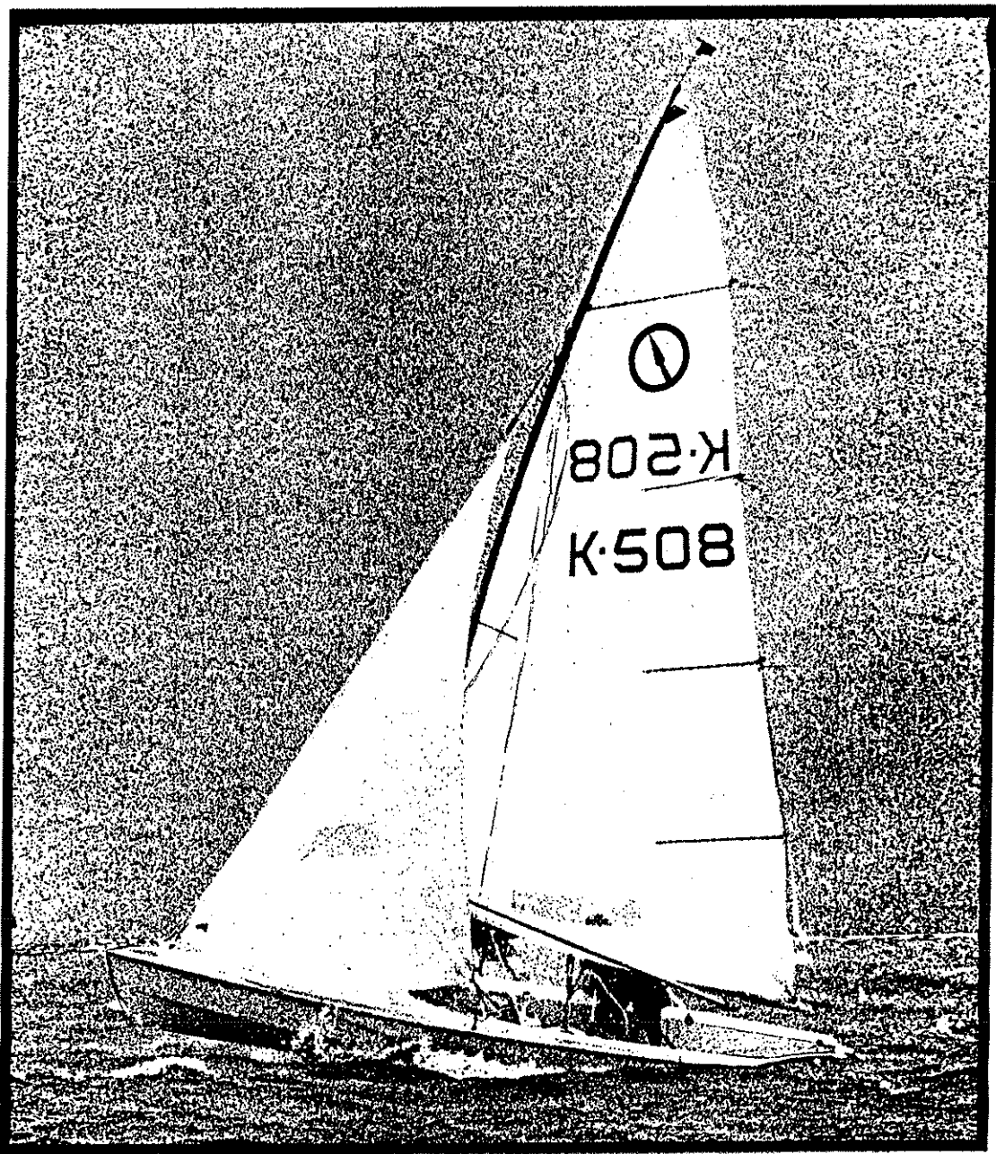
.DE GEBRS. ARTHUR IN AKTIE. EUROPESE KAMPIOENEN 1986.

OFFICIEEL ORGAAN DER NJKO. 15e JAARGANG NR 3 . SEPTEMBER 19 86 .